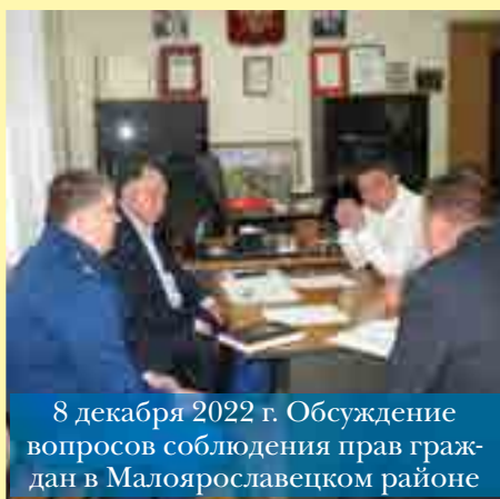
8 декабря 2022 г. Обсуждение вопросов соблюдения прав граж- дан в Малоярославском районе