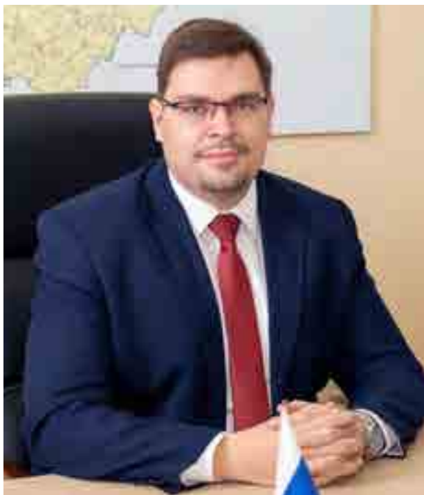
Павел Коновалов, министр труда и социальной защиты Калужской области

Законом Калужской области от 21.10.2022 № 274-ОЗ «Об установлении дополнительной меры социальной поддержки гражданам Российской Федерации, призванным на военную службу по мобилизации в Вооруженные Силы Российской Федерации» установлена дополнительная мера социальной поддержки гражданам Российской Федерации, призванным на военную службу по мобилизации в Вооруженные Силы Российской Федерации в соответствии с Указом Президента Российской Федерации от 21.09.2022 № 647 «Об объявлении частичной мобилизации в Российской Федерации» с территории Калужской области военными комиссариатами муниципальных образований Калужской области, в виде единовременной денежной выплаты в размере 100 000 рублей.