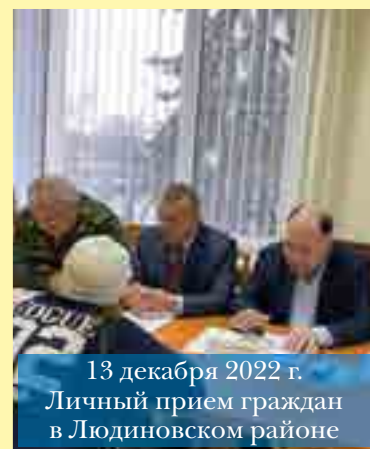
13 декабря 2022 г. Личный прием граждан в Людиновском районе