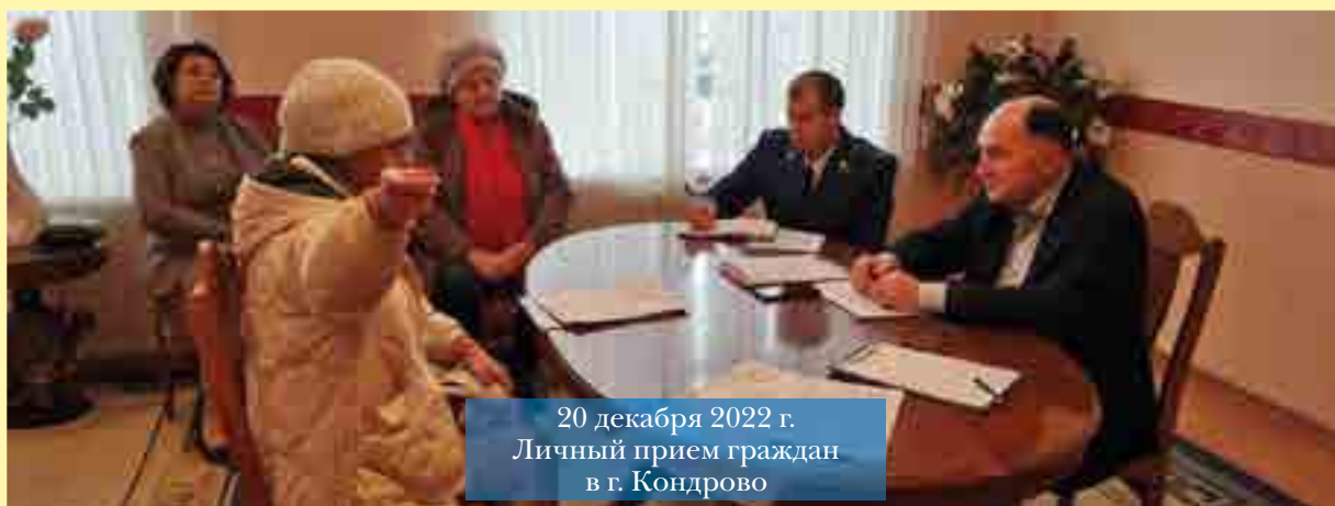
20 декабря 2022 г. Личный прием граждан в г. Кондрово