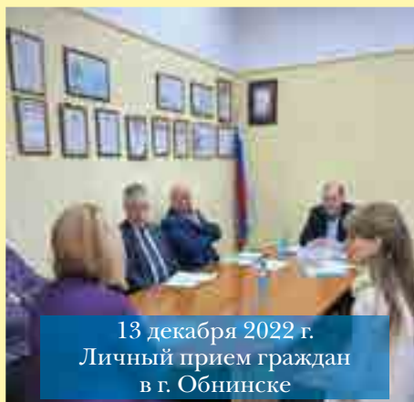
13 декабря 2022 г. Личный прием граждан в г. Обнинске