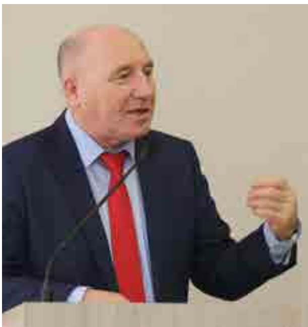
Александр Панин, Уполномоченный по правам человека в Белгородской области

Сегодня Белгородская область – в полном смысле полоса, приближенная к театру военных действий специальной военной операции. Каждый прилет снарядов со стороны Украины и другие происшествия, связанные со СВО, наносят прямой и косвенные ущербы Белгородской области. Региональные власти взяли на себя ремонт поврежденного и предоставление нового жилья белгородцам, а также выплаты компенсаций за разбитые автомобили, временное отселение людей из опасных для жизни сел и сопутствующие расходы (на сегодняшний день восстановлено почти 2000 домов и квартир, еще 500 – в работе).