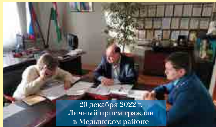
20 декабря 2022 г. Личный прием граждан в Медынском районе