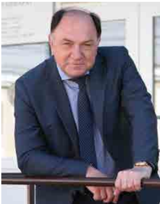
Юрий Зельников, Уполномоченный по правам человека в Калужской области

После объявления в Российской Федерации частичной мобилизации актуальным и востребованным стало направление по обеспечению, защите и восстановлению прав военных, служащих в зоне СВО, а также членов их семей.