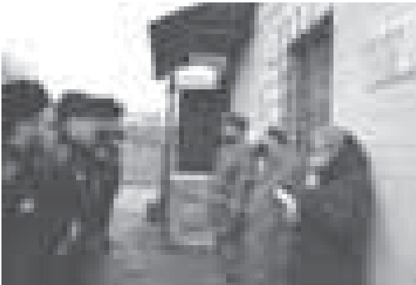
29.11.2021. г. Медынь. Посещение ИК-4