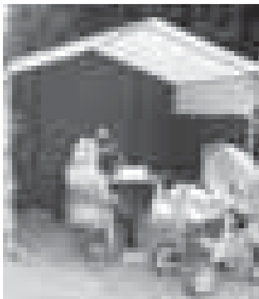
21.08.2021. г. Калуга. Юристы аппарата Уполномоченного проводят бесплатные юридические консультации в сквере Ветеранов на Московской площади