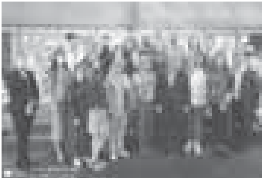
11.07.2021. г. Солнечногорск, Московская область. На российском молодежном форуме «Территория смыслов»