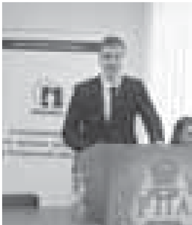
26.02.2021. г. Калуга. Научно-практическая конференция – финальный этап XIII областного конкурса научных работ студентов «Права человека и будущее России»