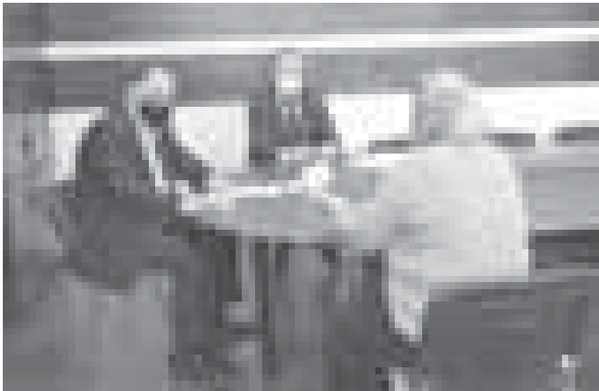
25.10.2021. г. Калуга. Личный прием граждан в офисе Уполномоченного