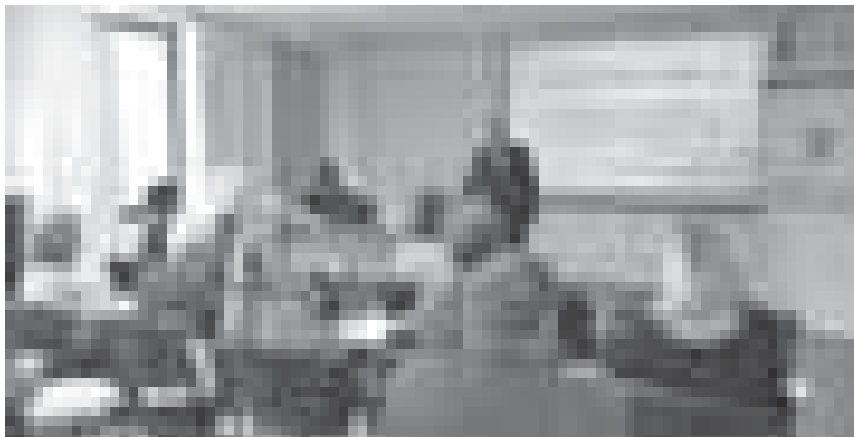
01.10.2021. г. Калуга. Семинар-тренинг «Теоретические и практические вопросы деятельности доверенных лиц Уполномоченного на местах»