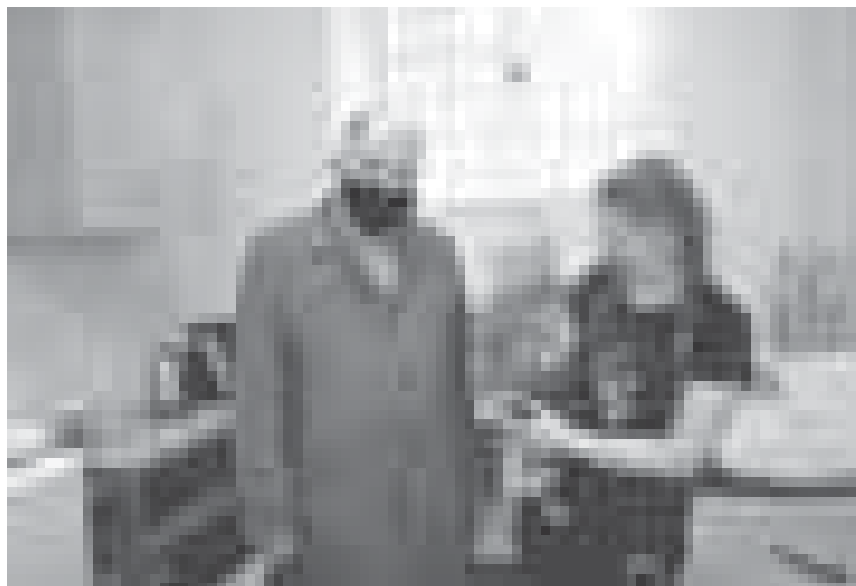
16.12.2021. г. Калуга. Посещение СИЗО-1