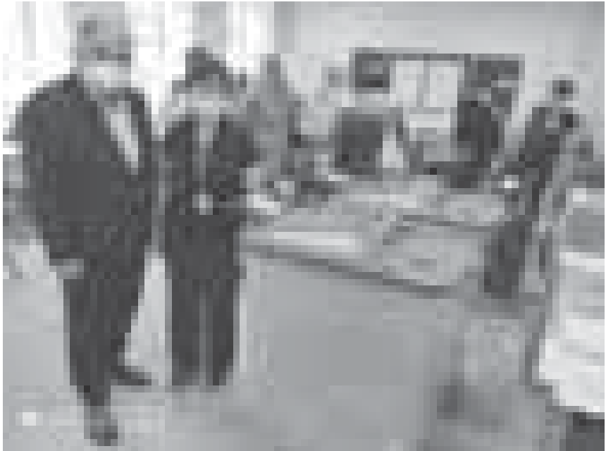
17.09.2021. г. Калуга. Уполномоченный на избирательном участке