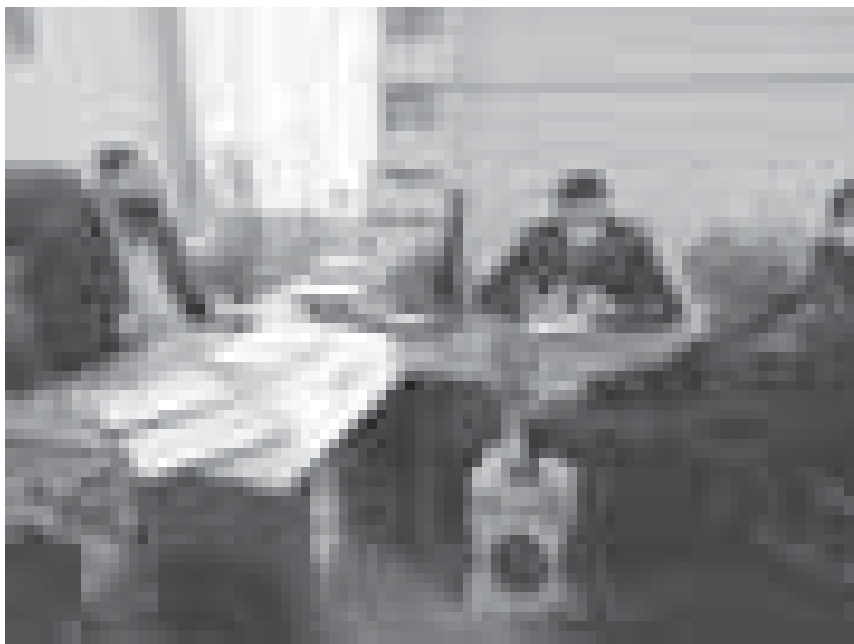
21.10.2021. г. Малоярославец. Уполномоченный ведет личный прием граждан