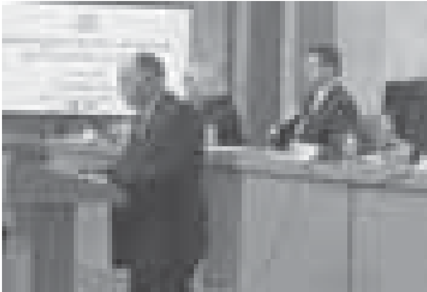
15.04.2021. г. Калуга. Уполномоченный представляет депутатам Законодательного Собрания Калужской области ежегодный доклад