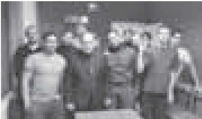
29.01.2021. г. Калуга. Калужский спецприемник для содержания лиц, арестованных в административном порядке