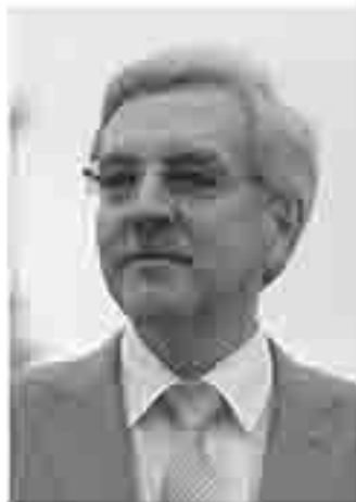
Александр Шашов, Уполномоченный на правах члена в Санкт-Петербурге

Деятельность Уполномоченного по правам человека в Санкт-Петербурге тесно связана с общественными организациями (НКО).