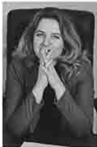
Ольга Коробова, Уполномоченный по правам ребенка в Калужской области

Ольга из категории гражданских активистов и демократической оппозиции Российской Федерации является формированием полноценной системы поддержки детства.