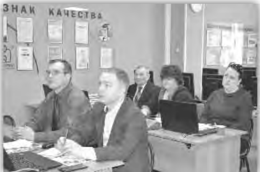
03.04.2019. г. Калуга.Семинар-практикум для пользователей справочно-правовой системой «КонсультантПлюс» (сотрудников аппарата Уполномоченного)