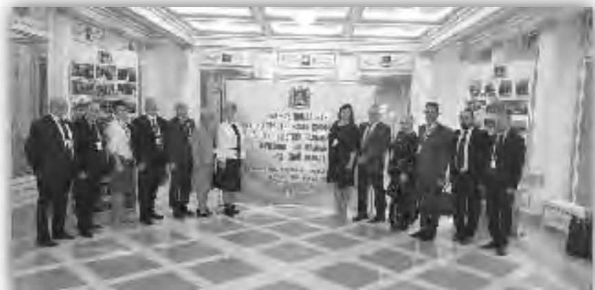
17.10.2019. г. Брянск. Участники межрегиональной научно-практической конференции, посвященной основным аспектам соблюдения и защиты прав граждан