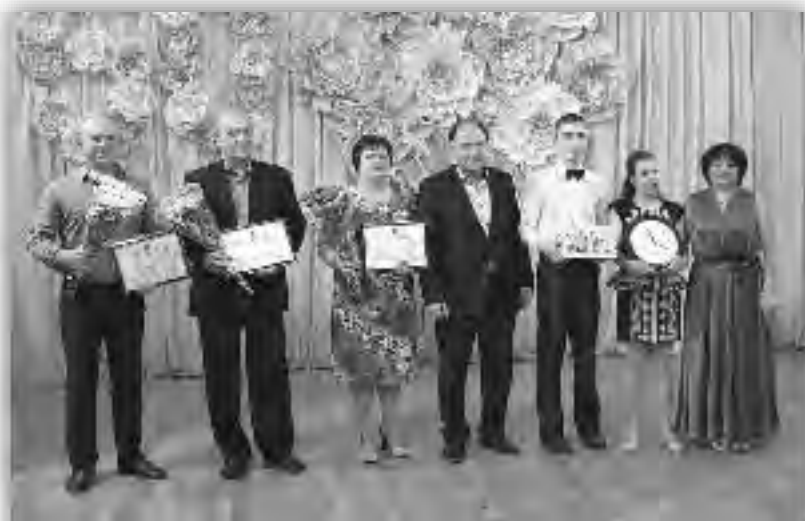
29.04.2019. п. Полотняный завод. Юбилей детского дома