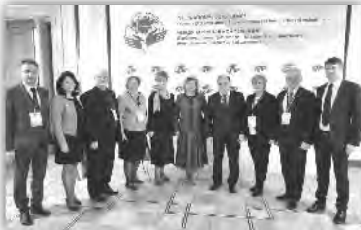
17.12.2019. г. Москва. III-я международная конференция «Проблемы защиты прав человека на евразийском пространстве: обмен лучшими практиками омбудсменов»