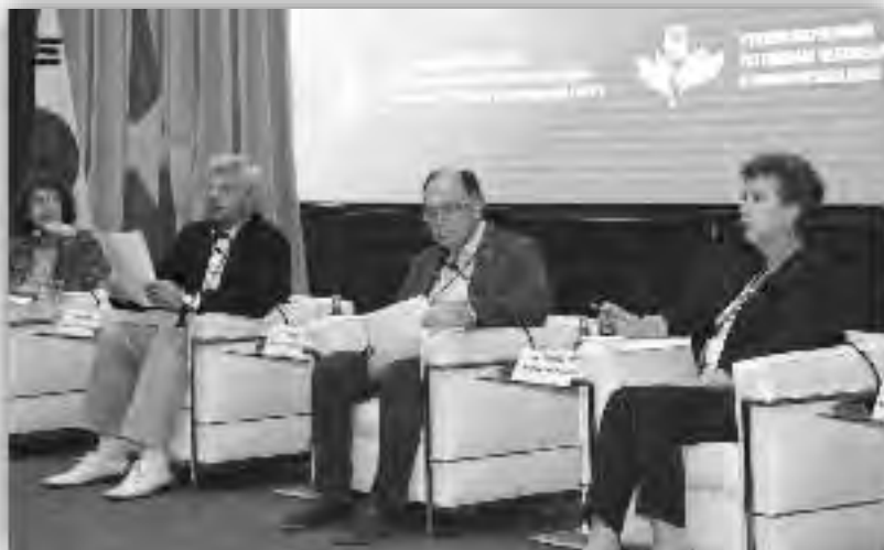
11–12.09.2019. г. Владивосток. Международная научно-практическая конференция Актуальные вопросы обеспечения прав и свобод человека и гражданина