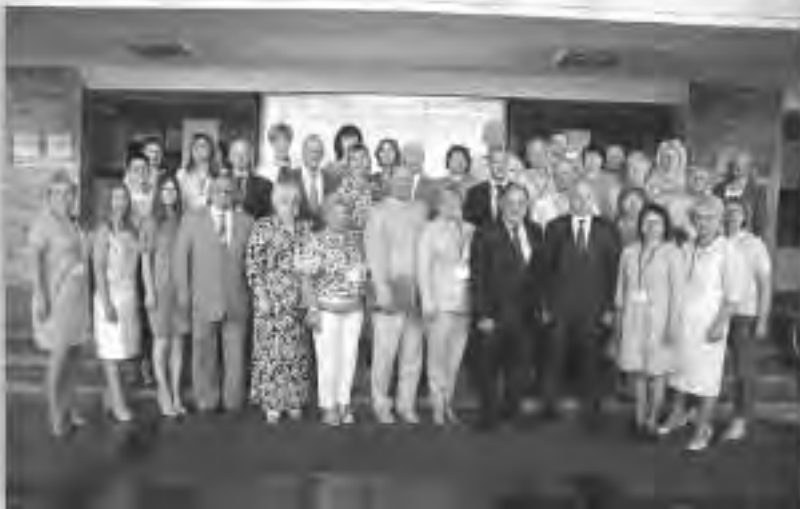
05.06.2019. г. Калуга. Участники межрегиональной научно-практической конференции и расширенного заседания Координационного совета Уполномоченного по правам человека в субъектах РФ, входящих в ЦФО