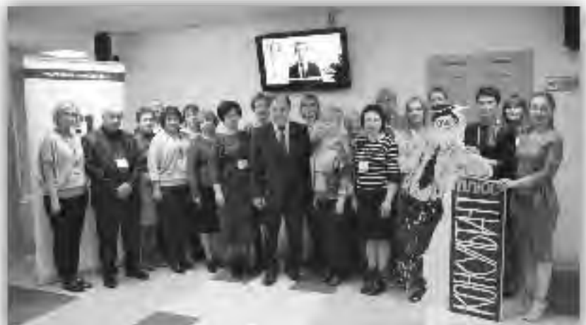
11.04.2019. г. Калуга.Семинар-практикум для доверенных лиц Уполномоченного на базе ГК Земля-СЕРВИС