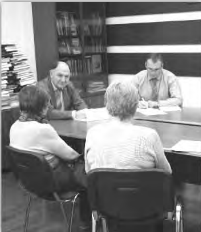
02.12.2019. г. Калуга. Личный прием в офисе Уполномоченного