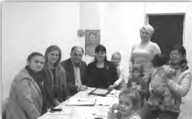
19.09.2019. г. Калуга. Встреча Уполномоченного с активистами калужского Центра помощи многодетным семьям «МногоМама»