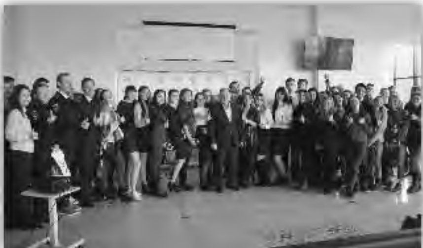
25.09.2019. г. Калуга. Встреча Уполномоченного со студентами КГУ им. К.Э. Циолковского