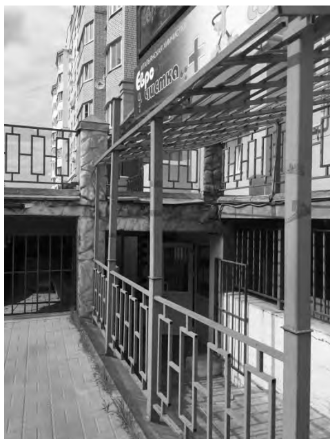
на пер. Теренинском, 9