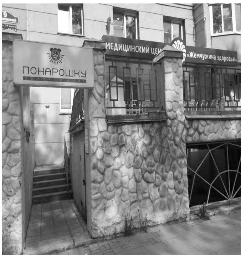
на пер. Теренинском, 9