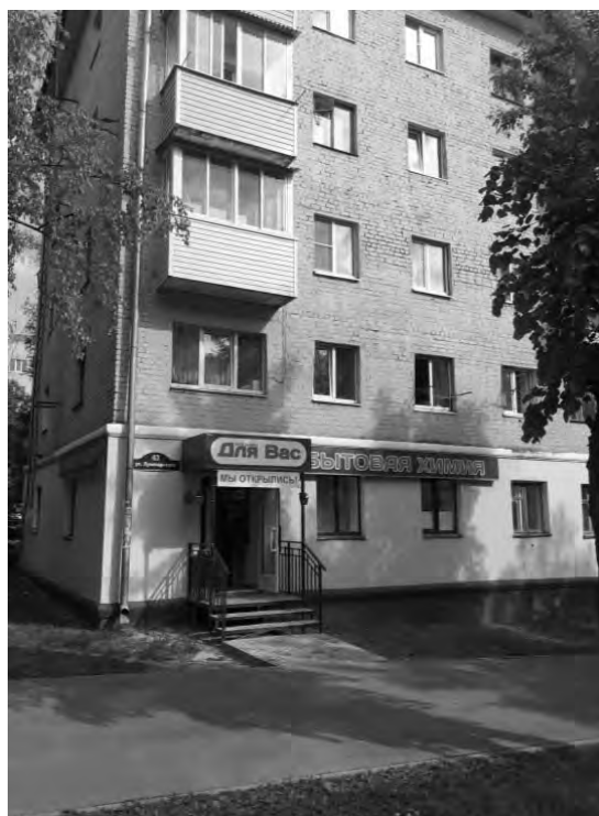
на ул. Луначарского, 63