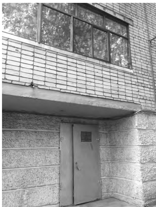
на ул. Николо-Козинской, 114

Клинико-диагностическая и бактериологическая лаборатория