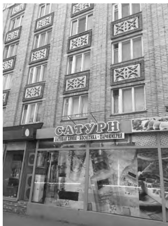
на площади Победы, 10