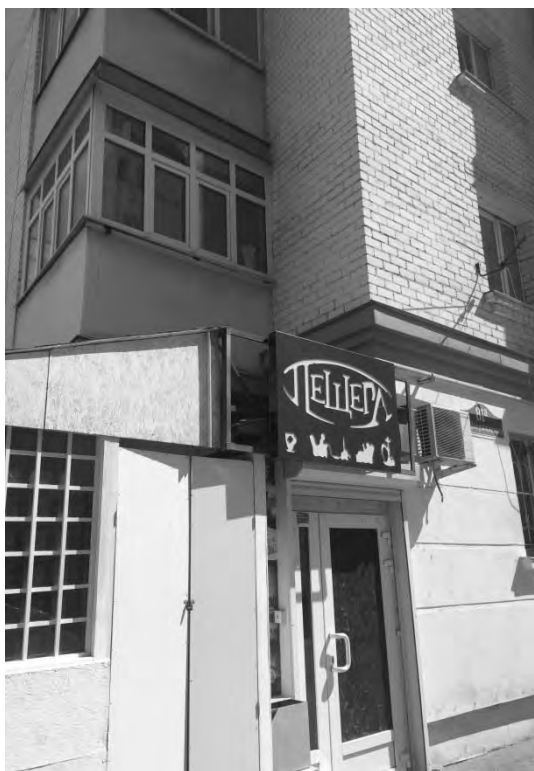
на ул. Дзержинского, 81а