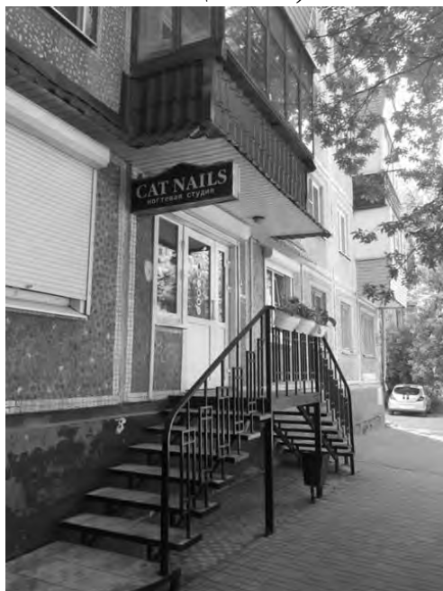
на ул. Дзержинского, 3

Ногтевая студия (предприятие бытового обслуживания, в котором применяются легковоспламеняющиеся вещества)