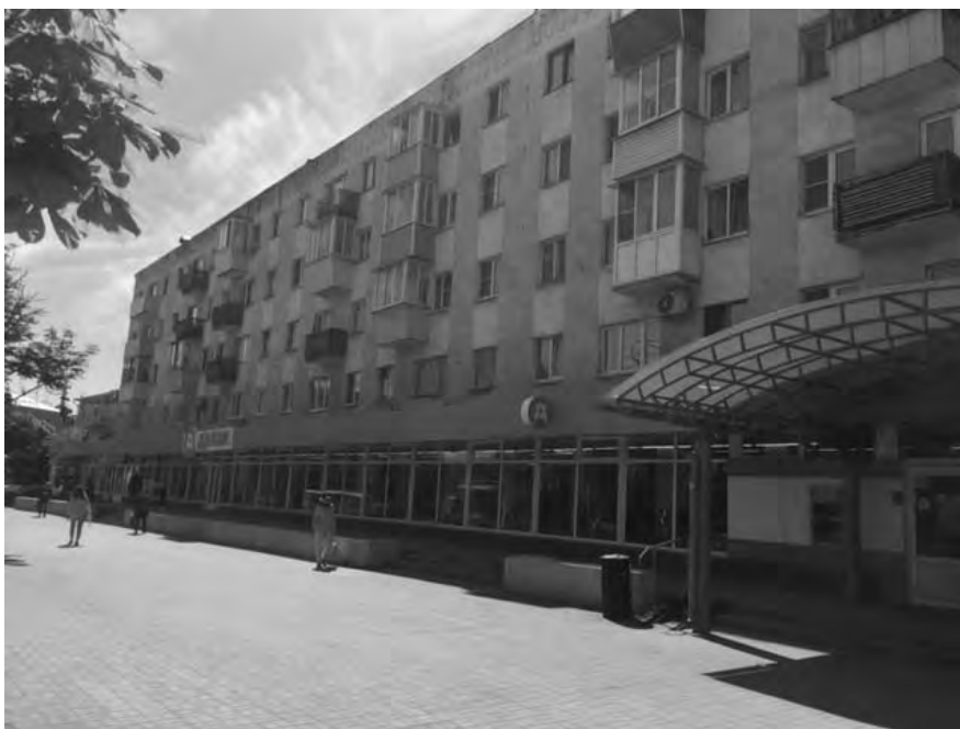
Магазин с круглосуточным режимом работы 24 часа в сутки на площади Победы, 11/2