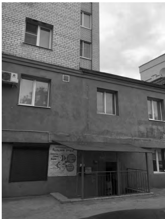
на пер. Старообрядческом, 9