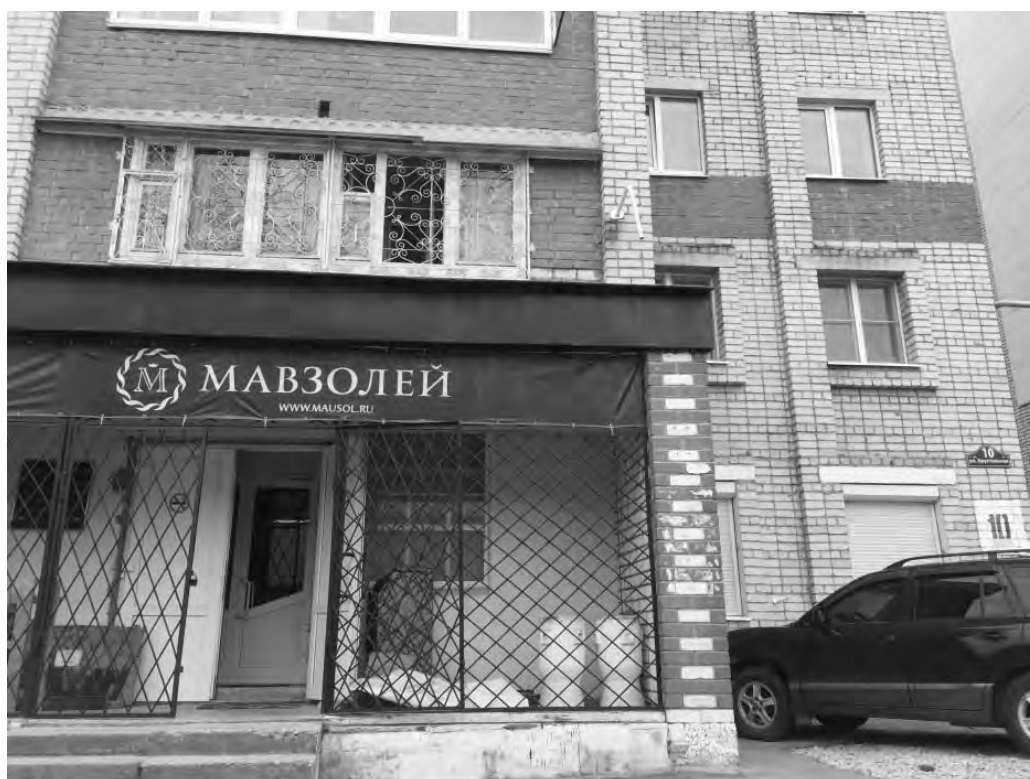
на ул. Хрустальной, 10