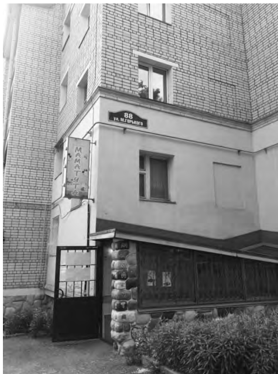
на ул. Горького, 88