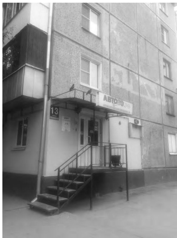
на ул. Телевизионной, 13