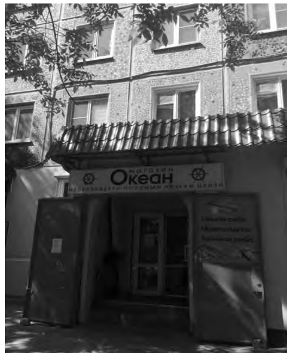
на ул. Фр. Энгельса, 38