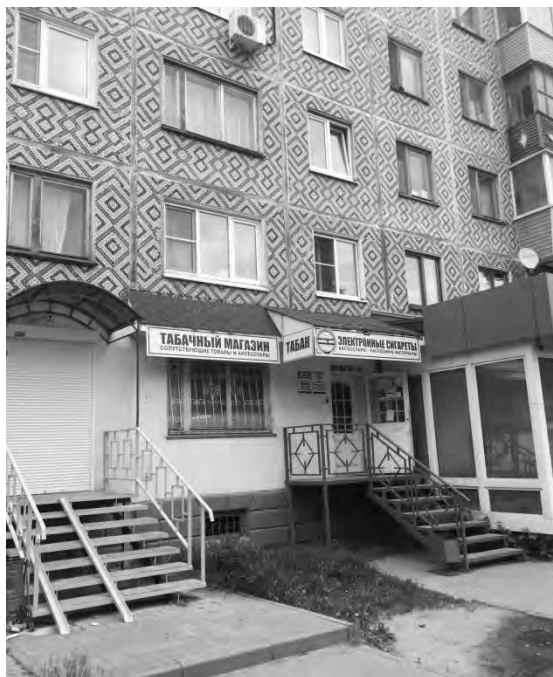
Табачный магазин на ул. Жукова, 3

Магазин с хранением в нем сжиженных газов, легковоспламеняющихся и горючих жидкостей, взрывчатых веществ, способных взрываться и гореть при взаимодействии с водой, кислородом воздуха или друг с другом, товаров в аэрозольной упаковке