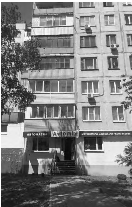
на ул. Чижевского, 25