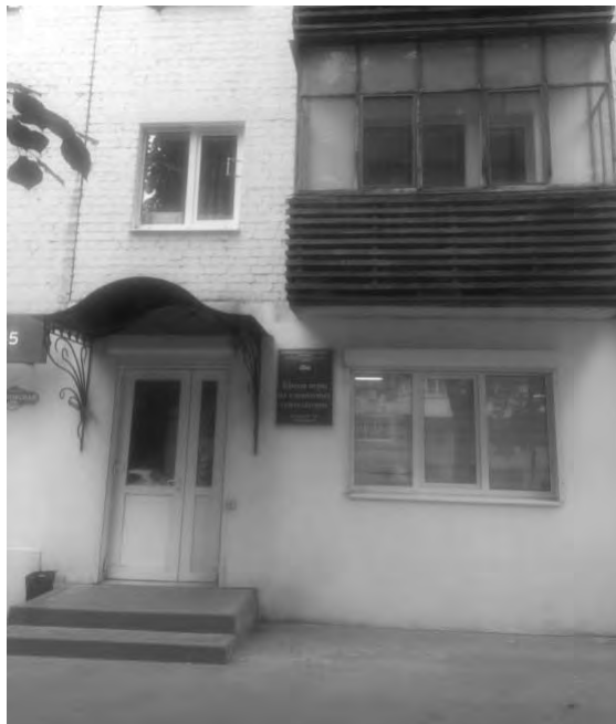
на ул. Московской, 109

Школа игры на клавишных синтезаторах (предприятие, функционирующее с музыкальным сопровождением)