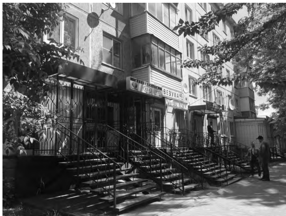
на ул. Чижевского, 23