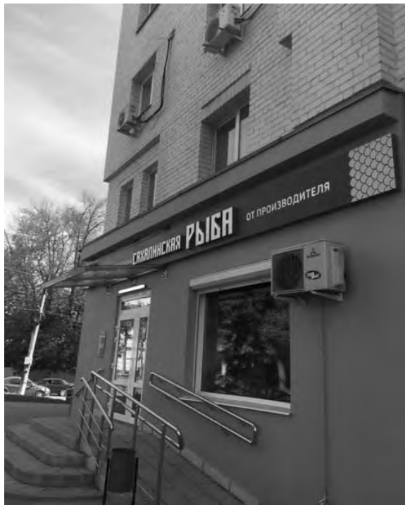
на ул. Дзержинского, 9/2