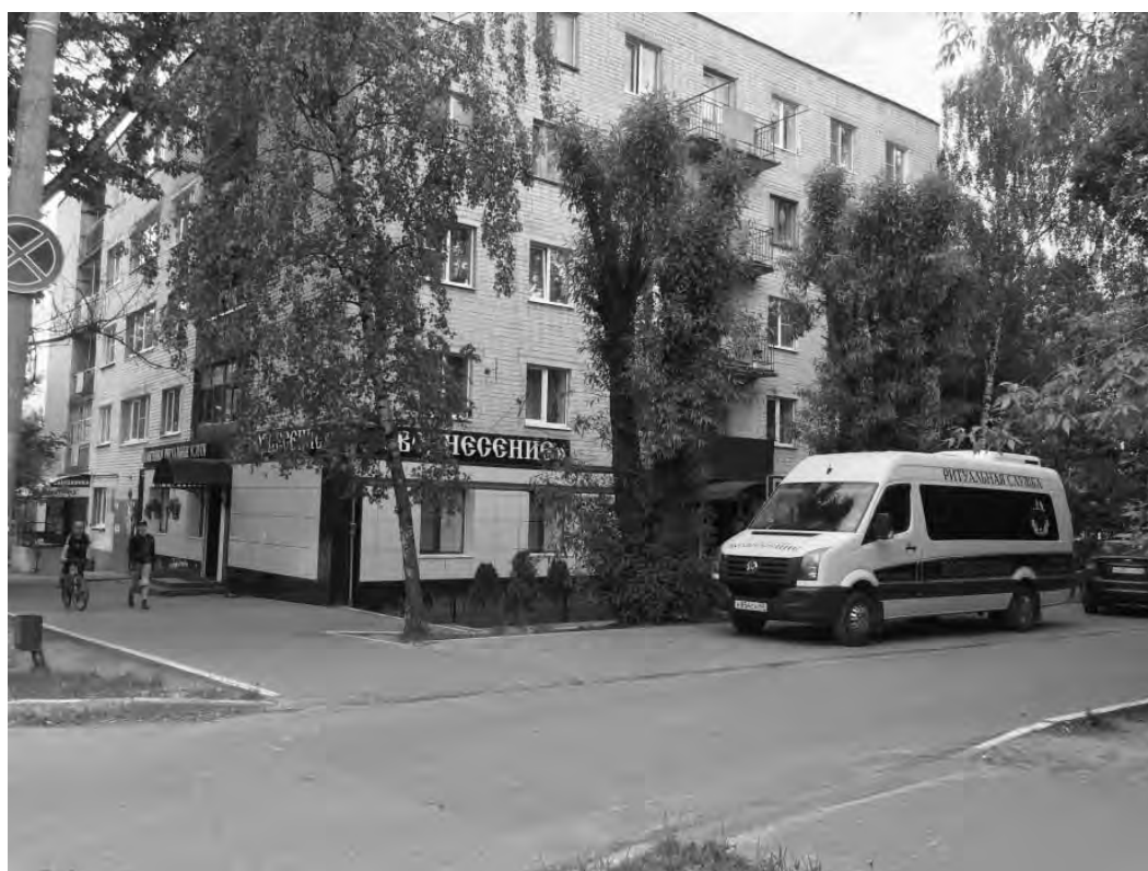
на ул. Жукова, 18