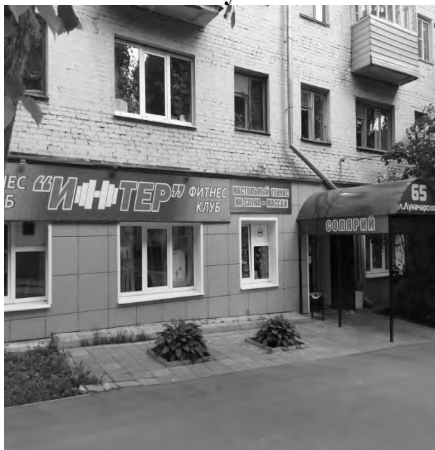
на ул. Луначарского, 65

Ногтевая студия (предприятие бытового обслуживания, в котором применяются легковоспламеняющиеся вещества)