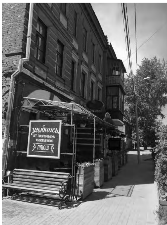
на ул. Дзержинского, 74